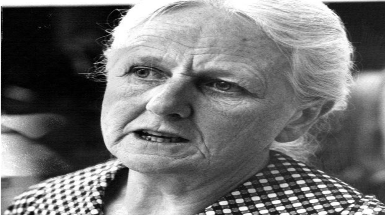
La británica Joan Robinson, la única mujer en la lista de "Los grandes economistas".